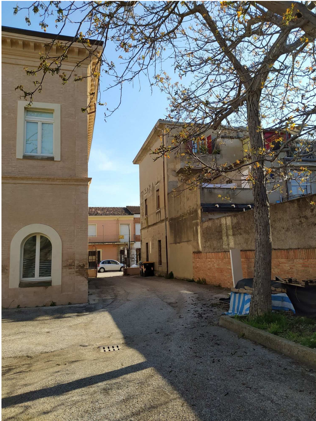
Foto 12 - Vista dal piazzale dell'ingresso all'area cortilizia