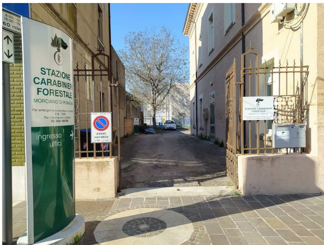
Foto 1 - Accesso all'area cortilizia da via G. Pascoli