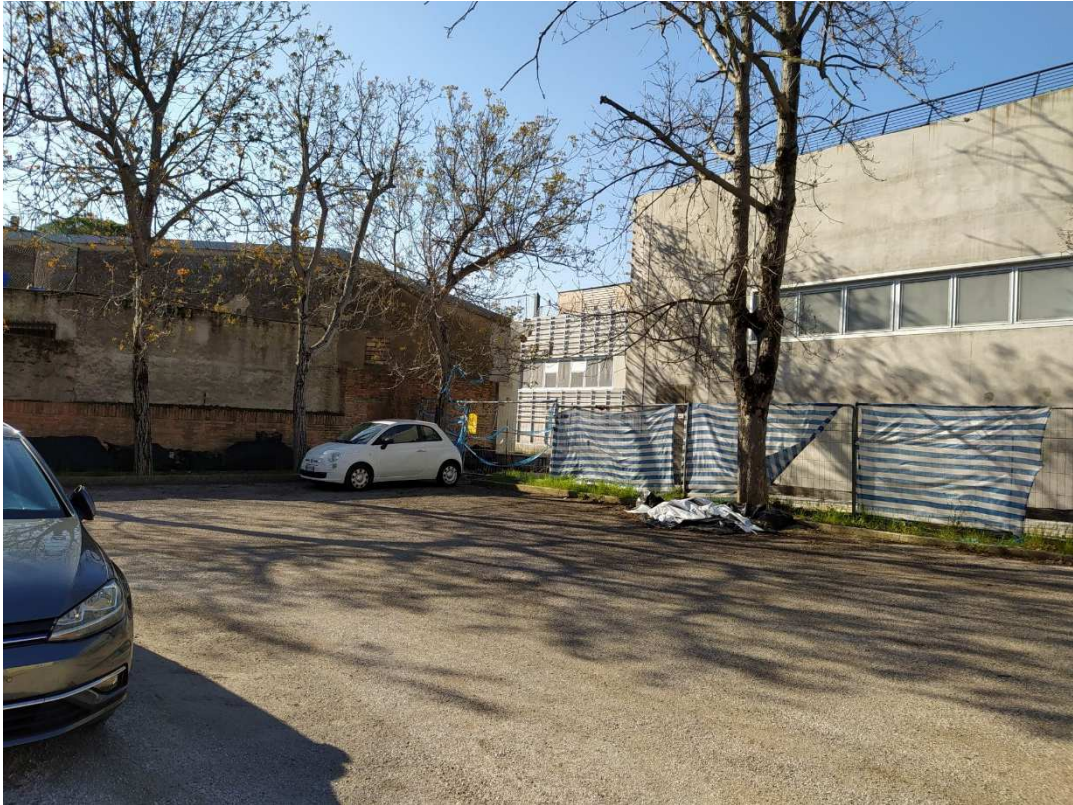
Foto 10 - Vista verso edifici confinanti sul lato nord-est