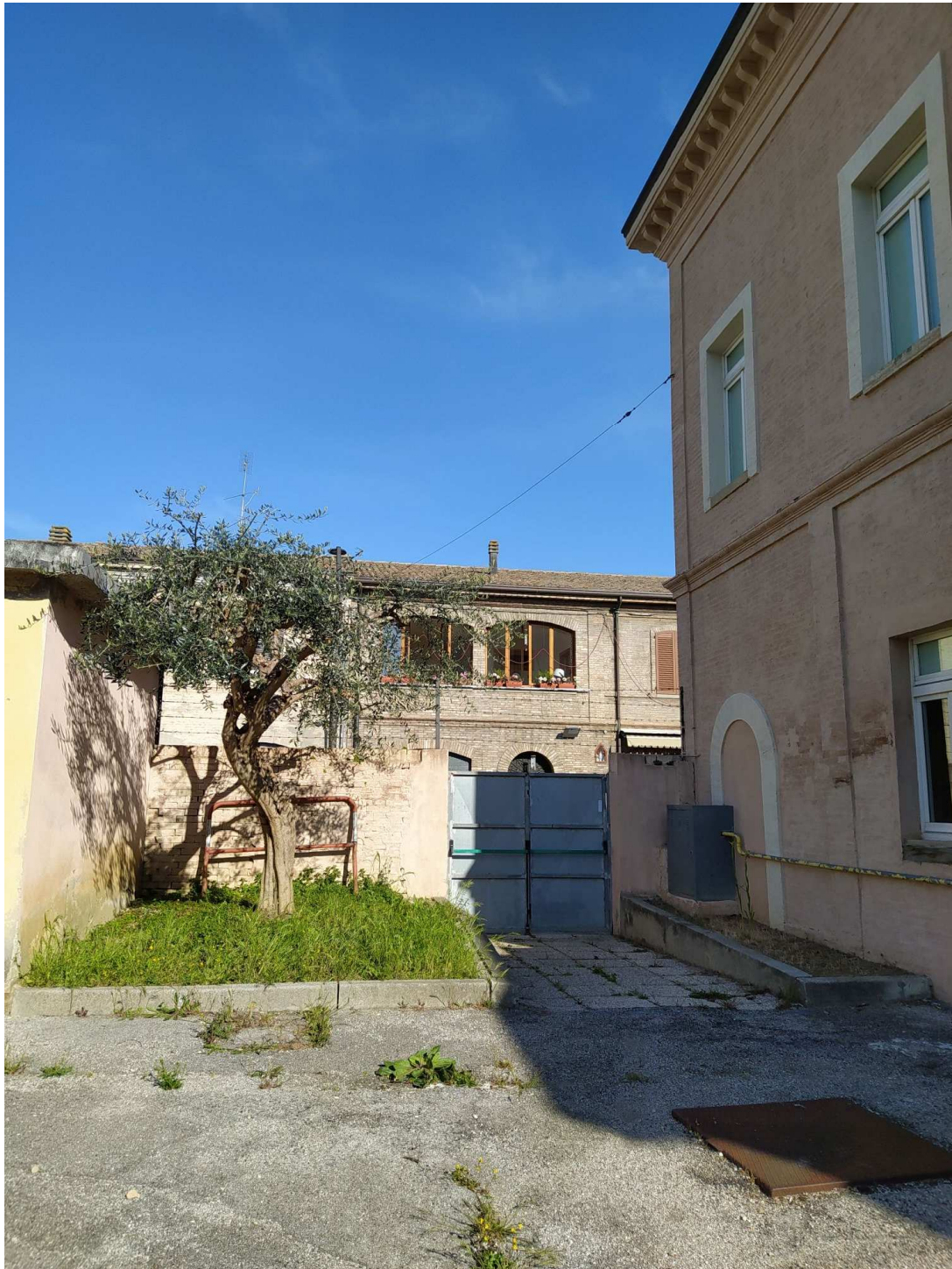
Foto 9 - Uscita di sicurezza su via Colombari con pianta di ulivo