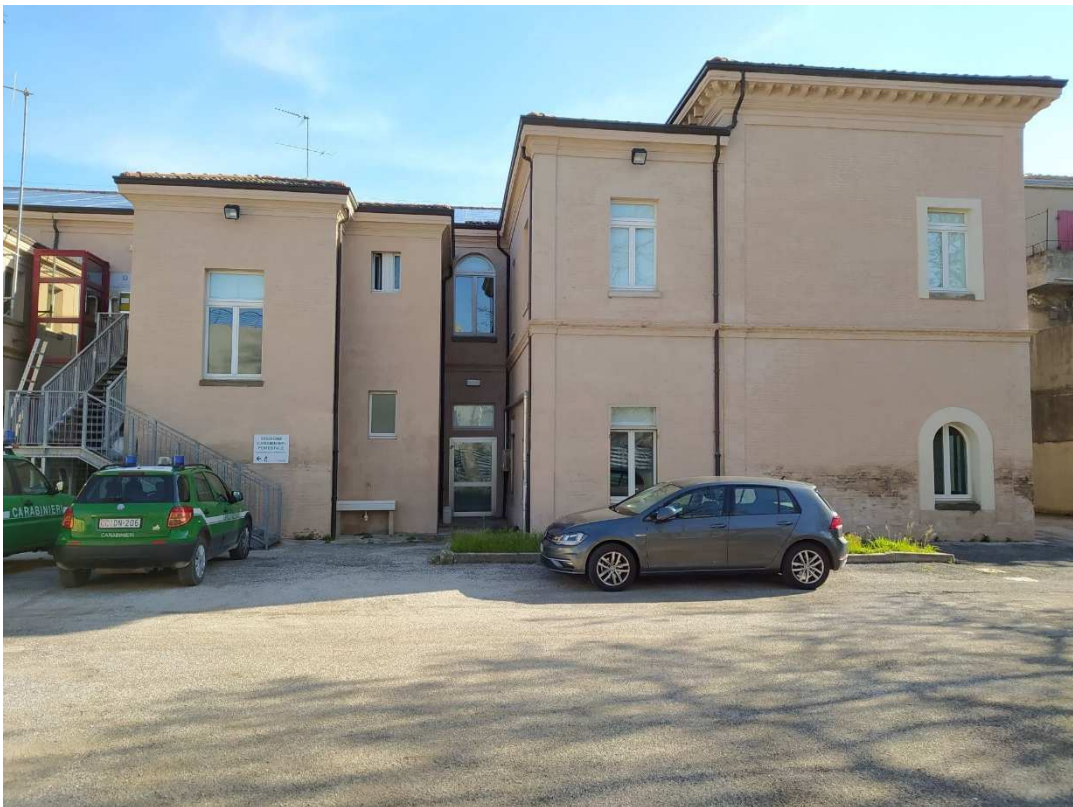
Foto 6 - Prospetto nord - parte destra