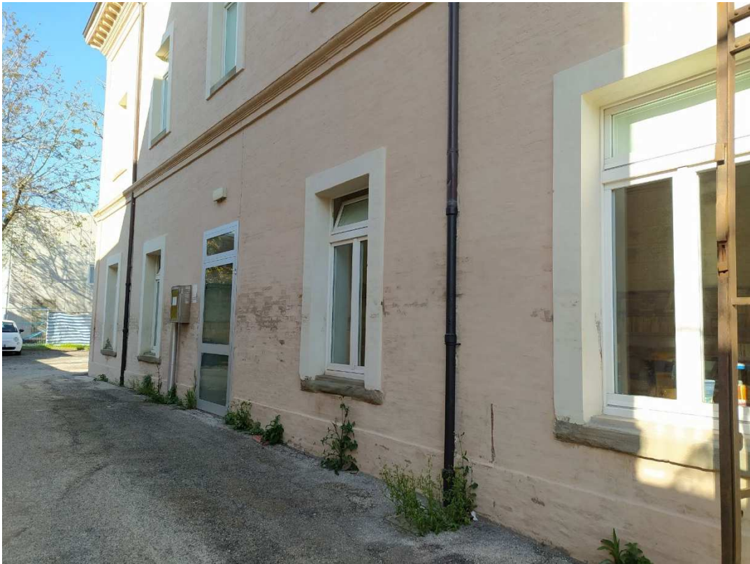
Foto 3 - Prospetto est