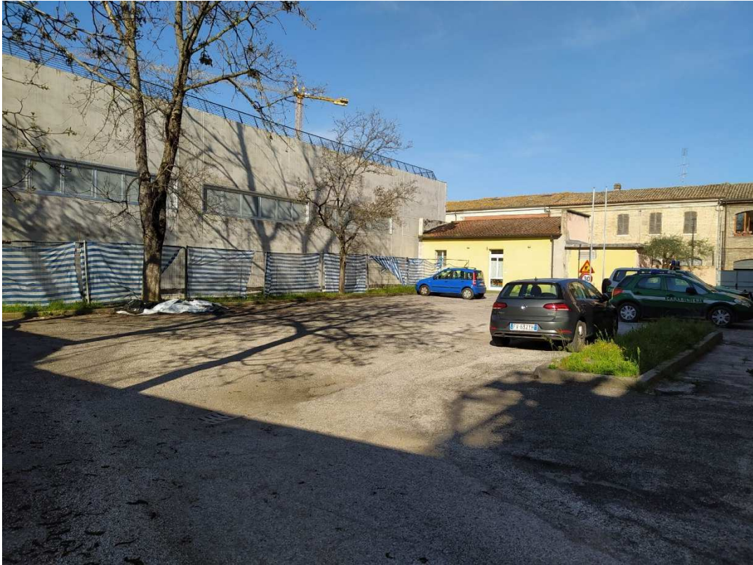
Foto 5 - Vista del piazzale verso il lato ovest con piante di ippocastano