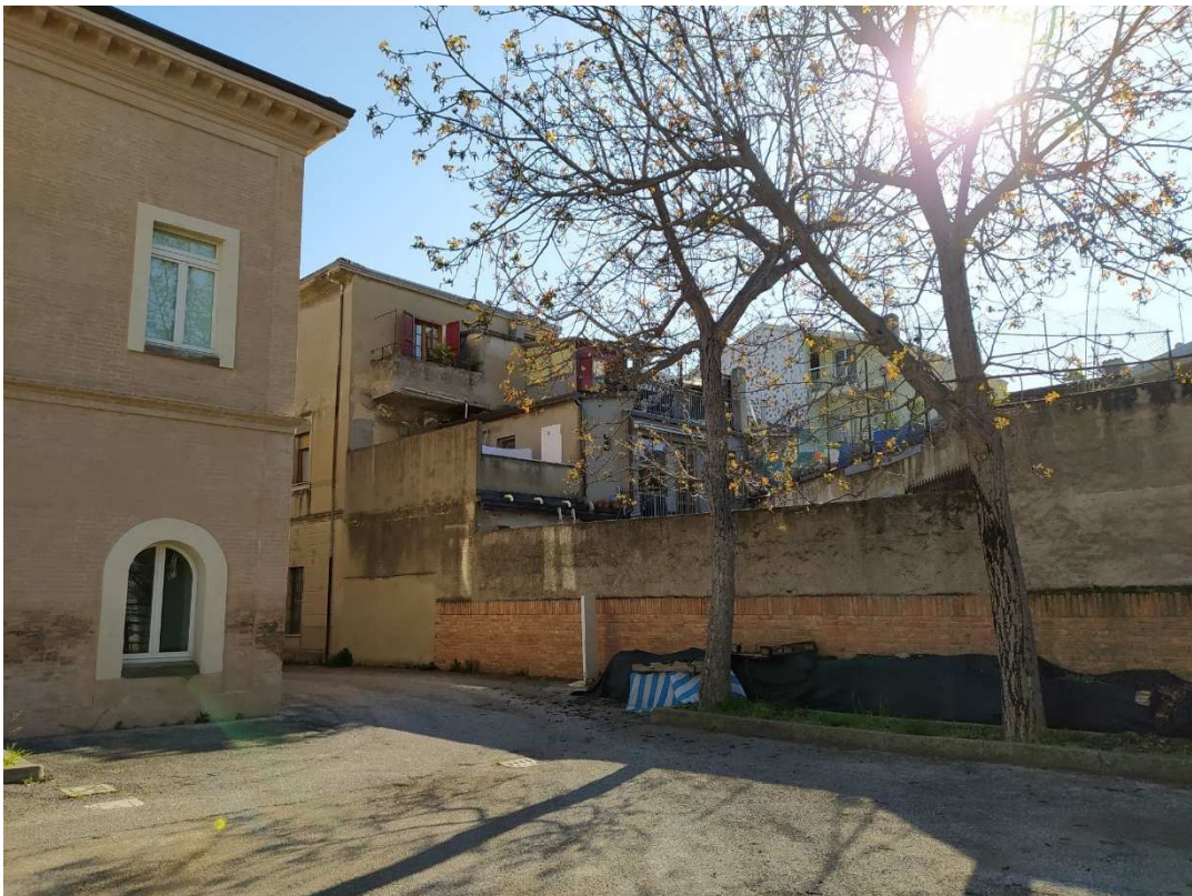
Foto 11 - Vista verso edifici confinanti sul lato est