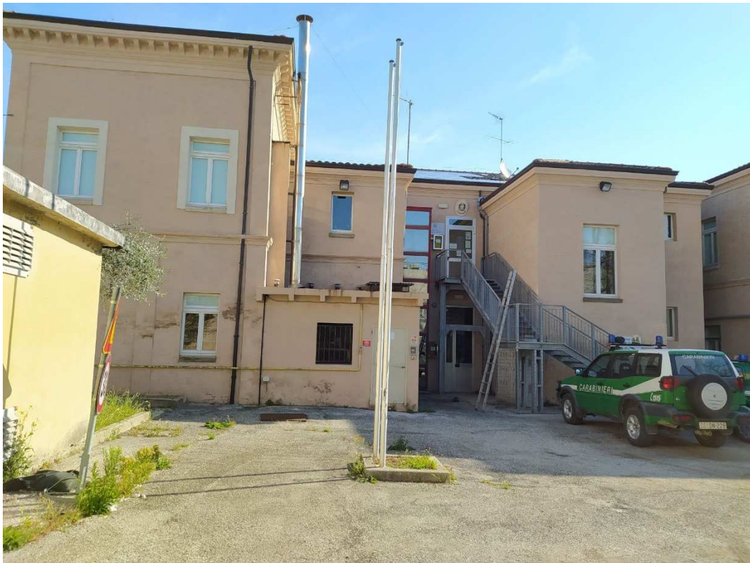
Foto 8 - Prospetto nord con aiuola quadrata