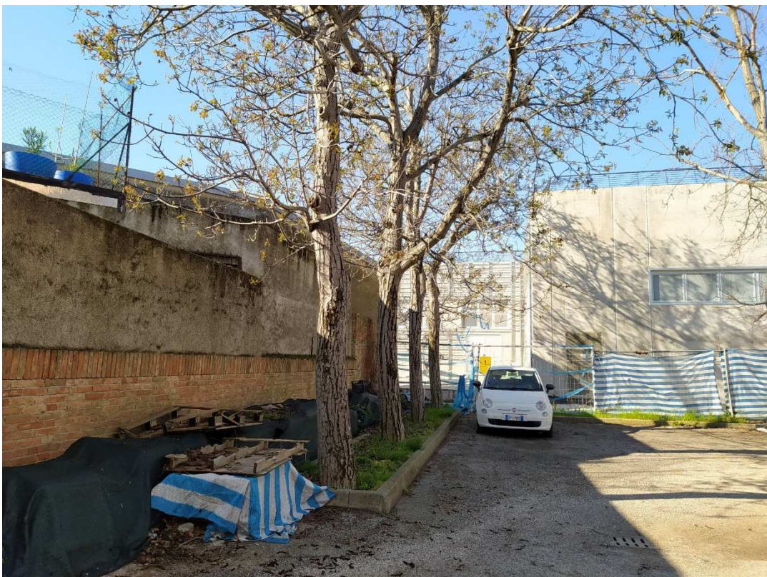
Foto 4 - Aiuola a est con piante di noce