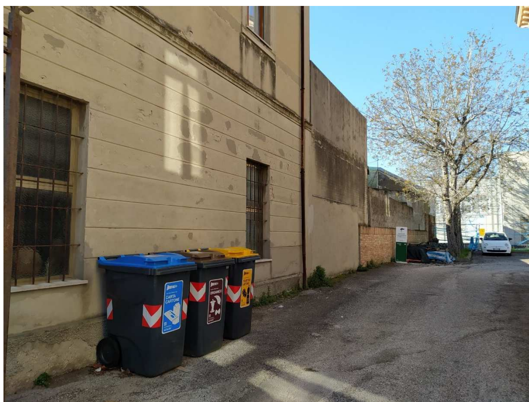
Foto 2 - Edificio confinante sul lato sinistro